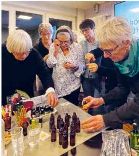
Neugierig und experimentierfreudig mischten sich die Workshop-Teilnehmerinnen ihren persönlichen Duftcocktail zusammen.

Die Auswahl der passenden Düfte folgt dabei allerdings keinen allgemeingültigen Regeln. Denn Gerüche sind stark mit persönlichen Erinnerungen verbunden und werden daher von Mensch zu Mensch ganz unterschiedlich wahrgenommen. Umso wichtiger ist es, bei der Auswahl biografische Erfahrungen und individuelle Vorlieben zu berücksichtigen.